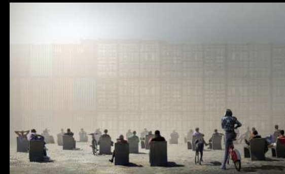
Argazkia: Expectación - Diego Pedra - Cornellà de Llobregat, Barcelona